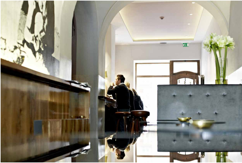
Erlkoenig_1333.jpg Historische Räumlichkeiten, kombiniert mit erlesenen Möbeln aus heimischem Nussholz – die Atmosphäre des Erlkönigs lebt vom raffinierten Kontrast.