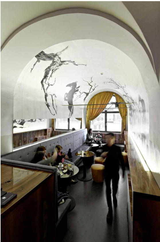
Erlkoenig_0153p.jpg Klassische Kaffeebar: Tagsüber ist der Erlkönig beliebter Treffpunkt für eine angenehme Unterbrechung des Alltags.