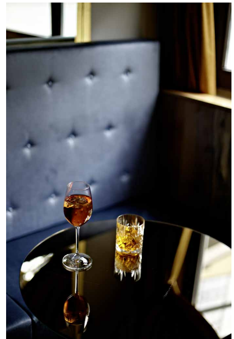
Erlkoenig_1280.jpg Gepflegt genießen. Im Erlkönig kommt nur das auf die Getränkekarte, was der Maitre für gut befunden hat.