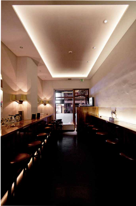
_DSC0791p.jpg Am Abend verleiht die ausgeklügelte Beleuchtung dem Erlkönig eine vollkommen neue Atmosphäre. Im Zusammenspiel mit Strukturen, Farben und Materialien entsteht eine fast sakrale Aura.