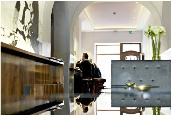
ERLKOENIG_1333.jpg Edle Materialien und Oberflächen schaffen eine entspannte und noble Atmosphäre und machen den „Erlkönig“ tagsüber zu einer klassischen Café-Bar.